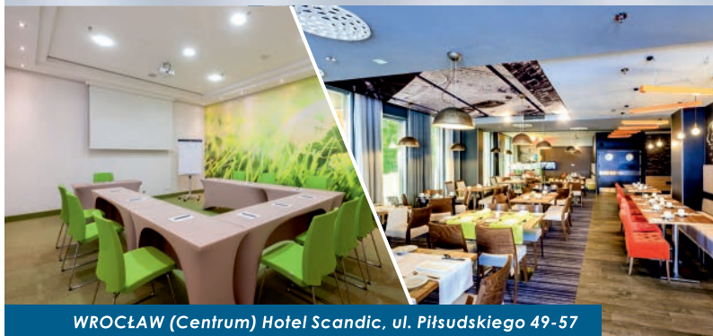
WROCLAW (Centrum) Hotel Scandic, ul. Piłsudskiego 49-57