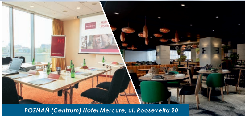
POZNAŃ (Centrum) Hotel Mercure, ul. Roosevelta 20