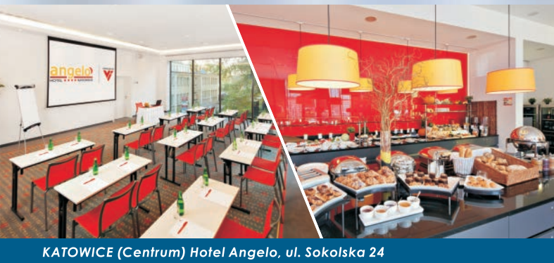
KATOWICE (Centrum) Hotel Angelo, ul. Sokolska 24