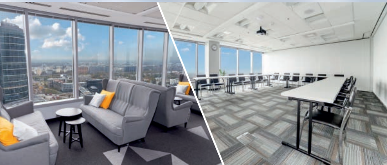
WARSAWA (Centrum) Golden Floor Tower, ul. Chłodna 51